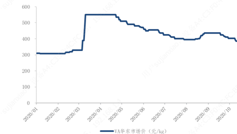
图 1：今年以来 VA 价格