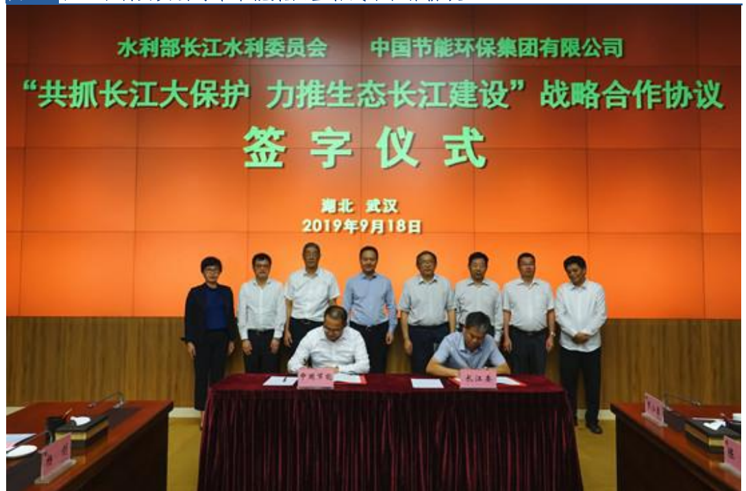
图 2: 长江水利委员会与中节能集团签署战略合作协议