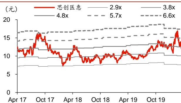
图表3: 思创医惠历史 PB-Bands